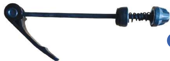
BD - 140