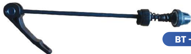
BT - 180