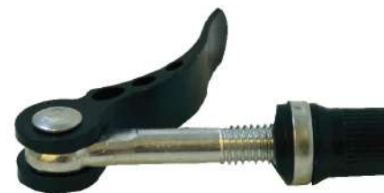
BS - 55