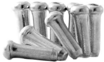
TC - 1003